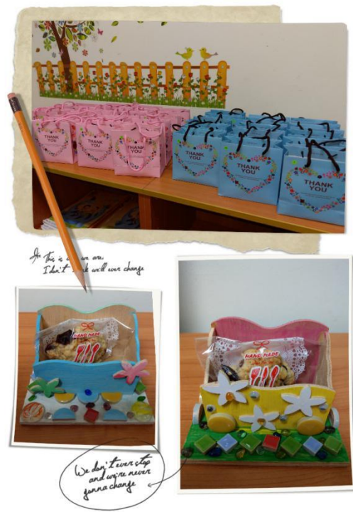
照片說明：學生用紙袋裝作品，回家送給媽媽。