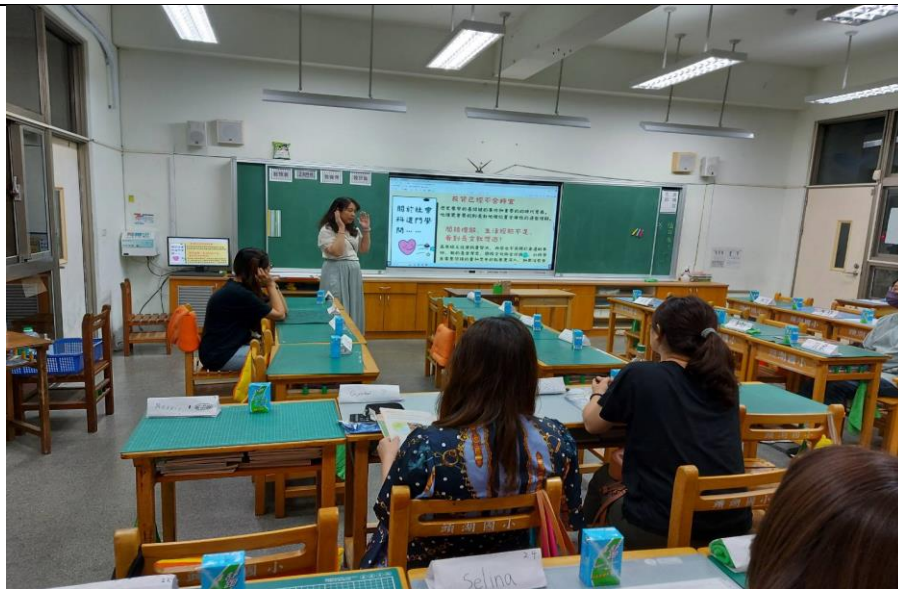
社會老師簡報說明~