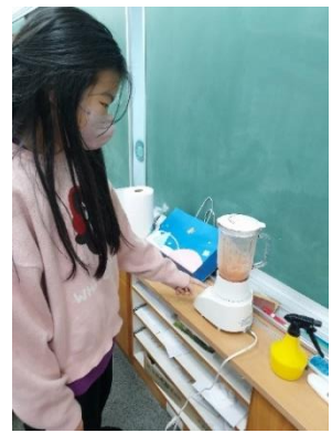
番茄醬備料與製作流程