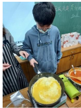
番茄醬與蛋的美味結合