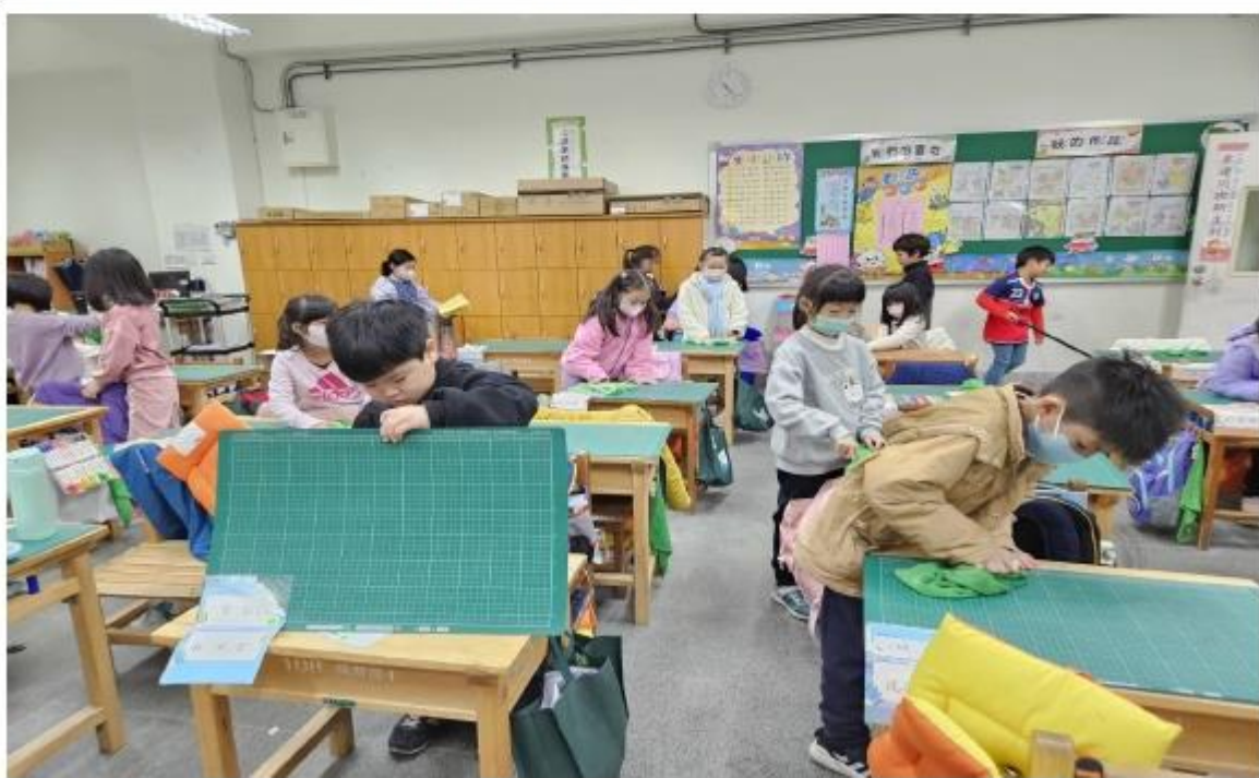
學生了解在校角色，並認真完成打掃任務