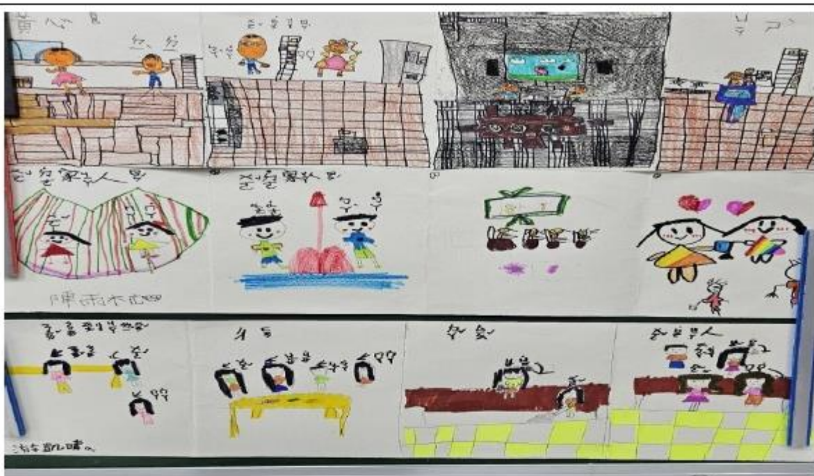
學生畫我的家人，與家人用餐，及協助家事分擔