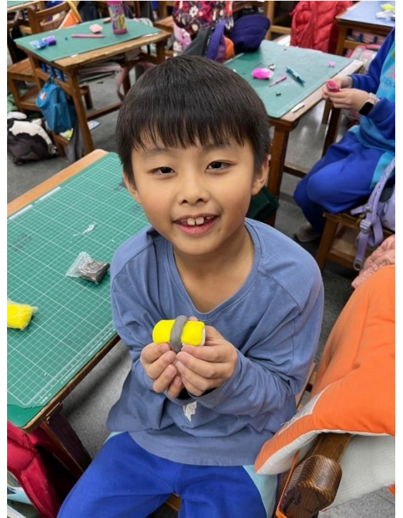
用黏土做出創意米食。