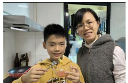
親子一起享用酸酸甜甜好滋味