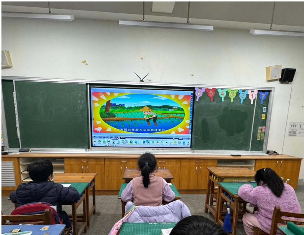
影片欣賞：了解農夫種稻的辛勞。