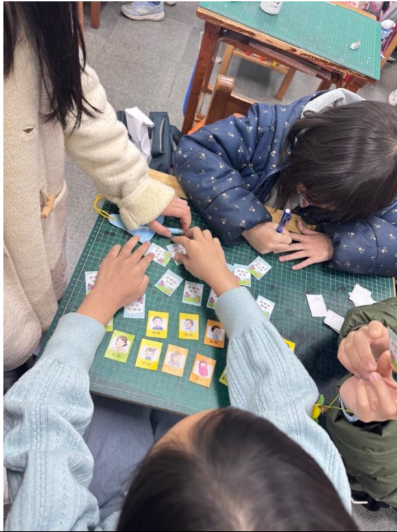
分組進行親人稱呼卡牌的遊戲加深正確稱呼親人的概念