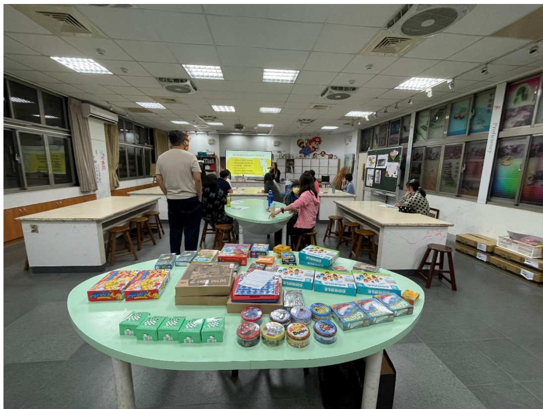
心理師講解桌遊如何玩出好行為