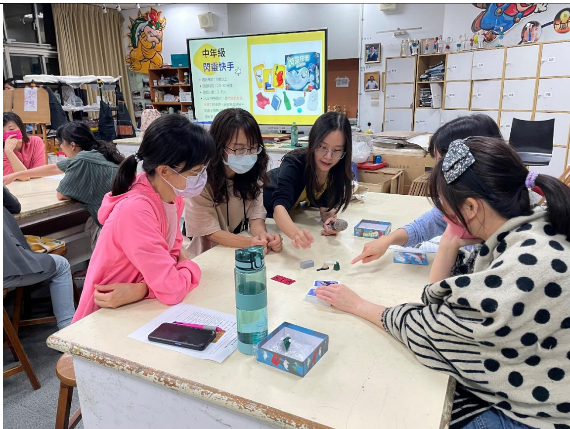
講師帶領參與者體驗桌遊