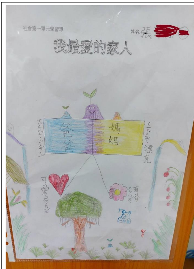
我最愛的家人學習單