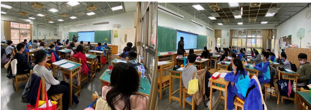
活動 1 從所學過的字出發各自的意思組合的了解字的意思。