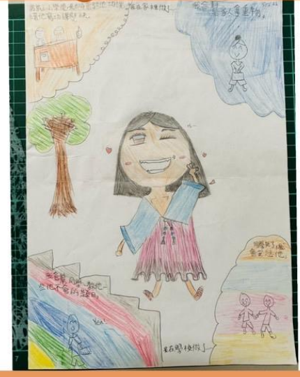
畫出自己並寫下自己目前擔任什麼角色。