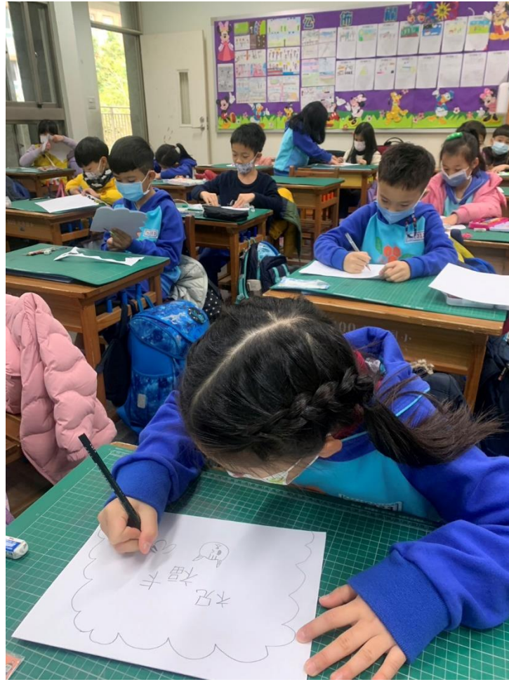
動手製作祝福卡片