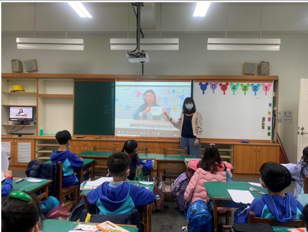
引導學生卡片的主題要清楚明確