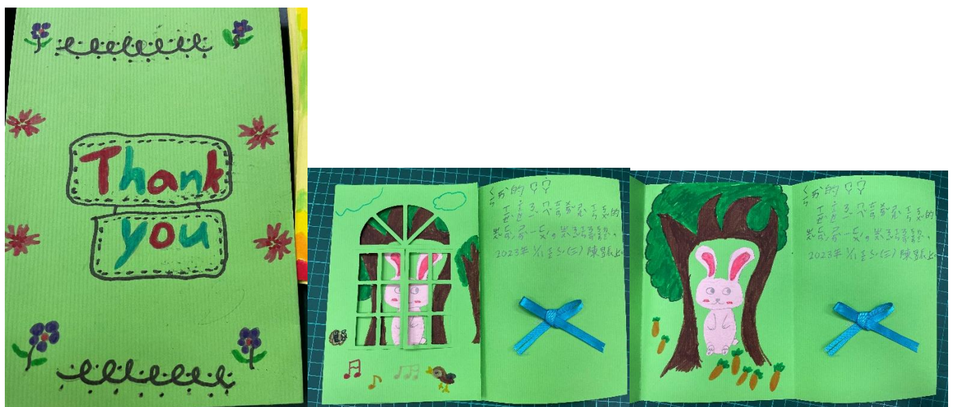
精心設計、用心製作的感謝卡完成囉!