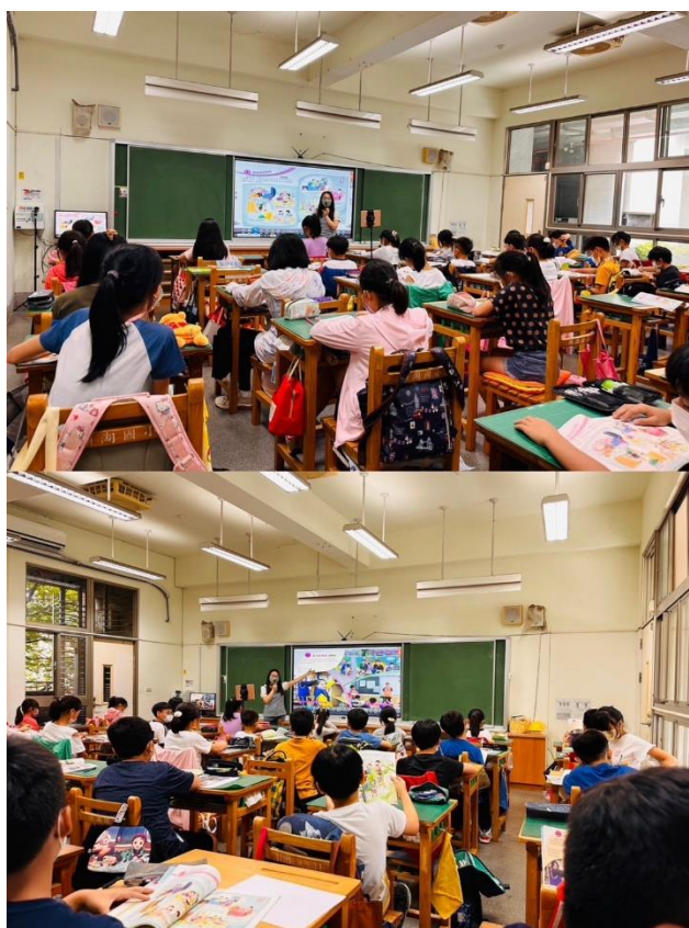
綜合課多元角色的探索。