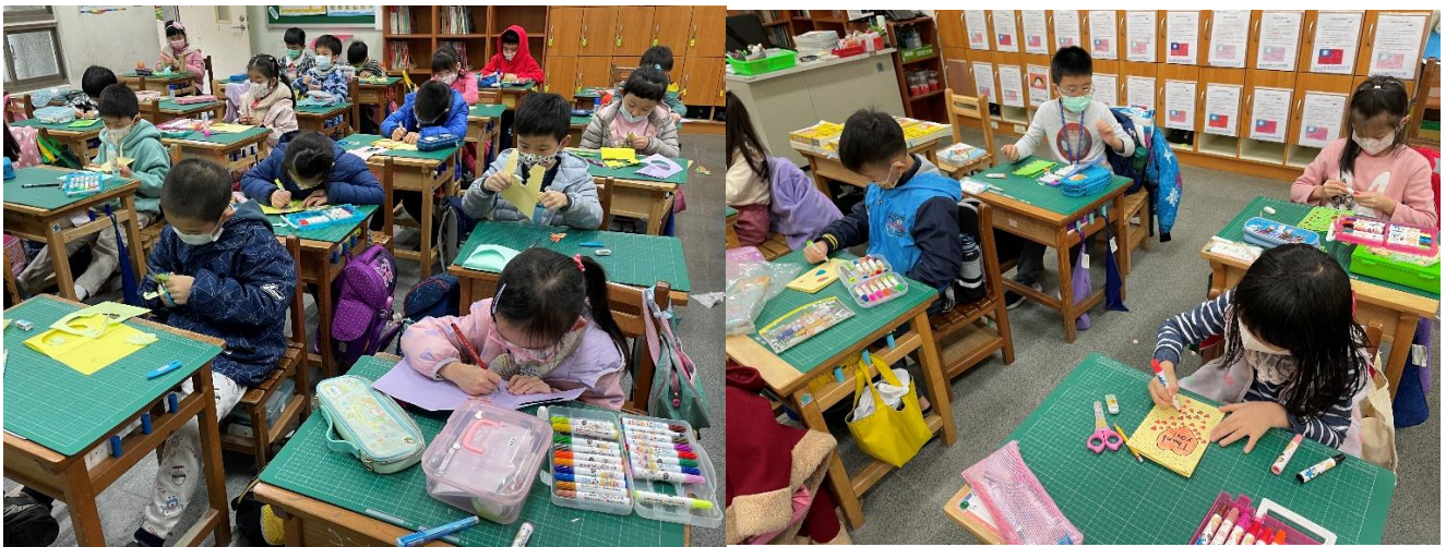
學生實作與老師巡視指導。