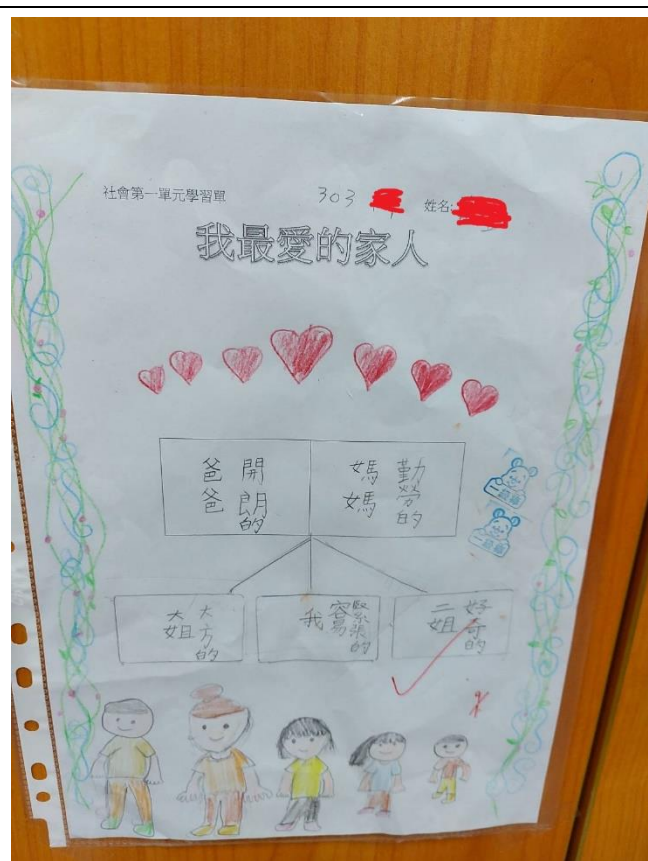
我最愛的家人學習單