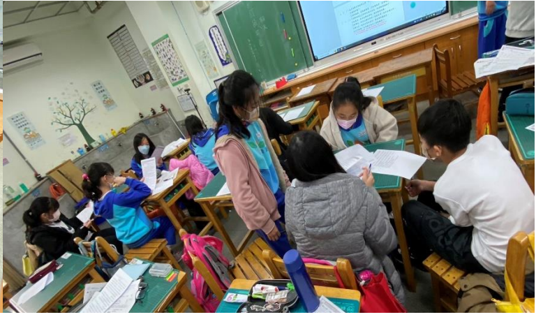
活動 2. 從四個字湊成四字語詞代表著什麼需要我們去探索。