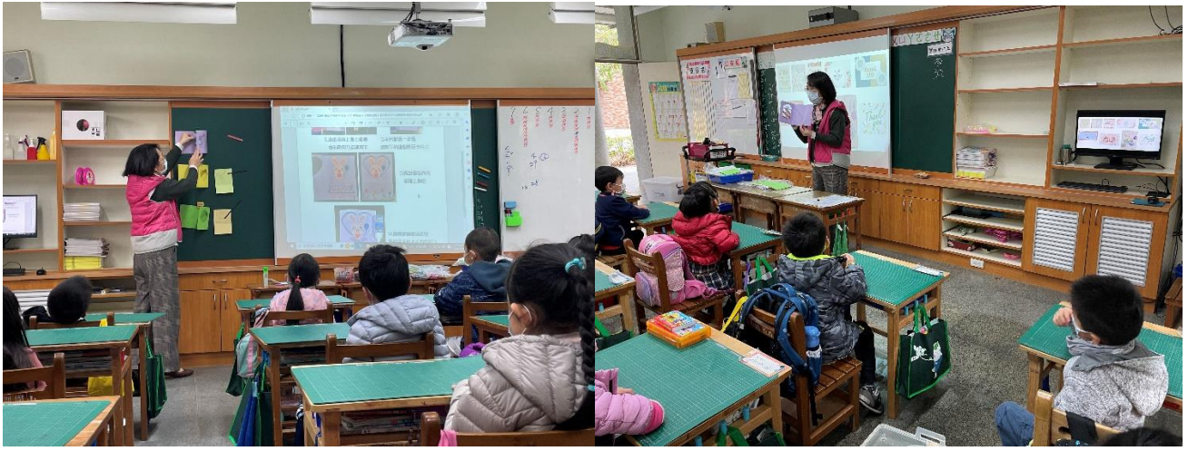
教師介紹卡片設計及製作說明、示範。