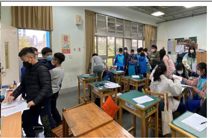
活動 3. 你所認知的品格別人了解多少呢?從自身開始介紹也觀察別人。