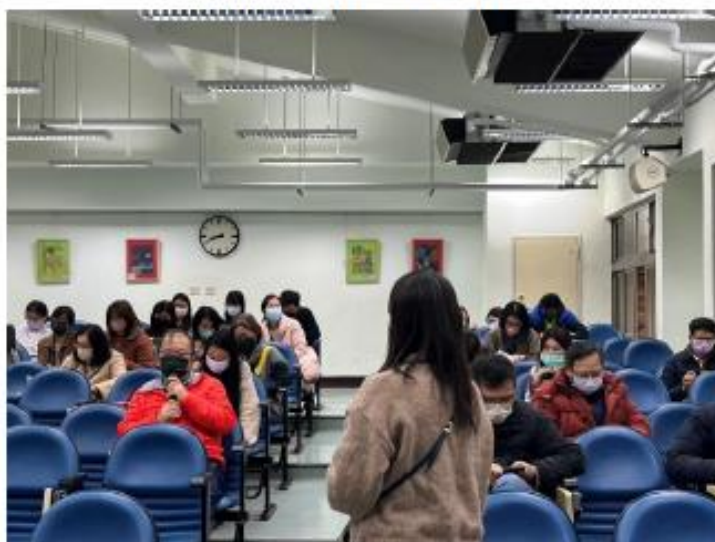
講師與老師們良好互動、分享