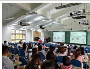
教官解說急救重要性及步驟