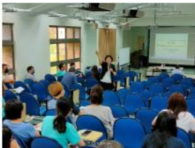
豐富且實務的內容深深吸引老師們專注聆聽