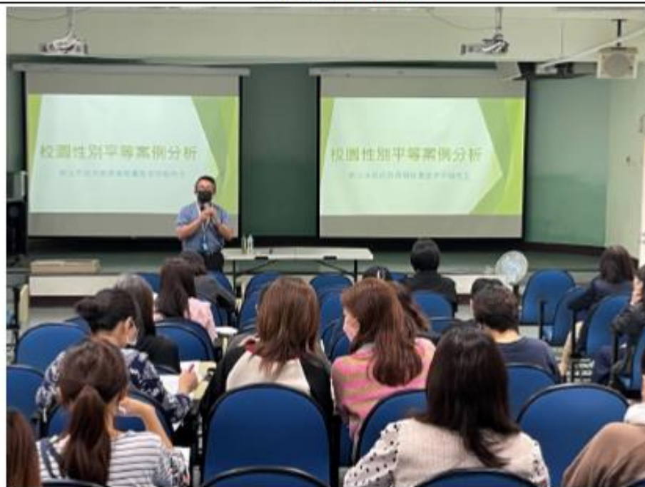
校長為研習作開場，並參與研習。