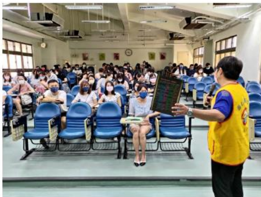
全校老師專注聽講師的演講