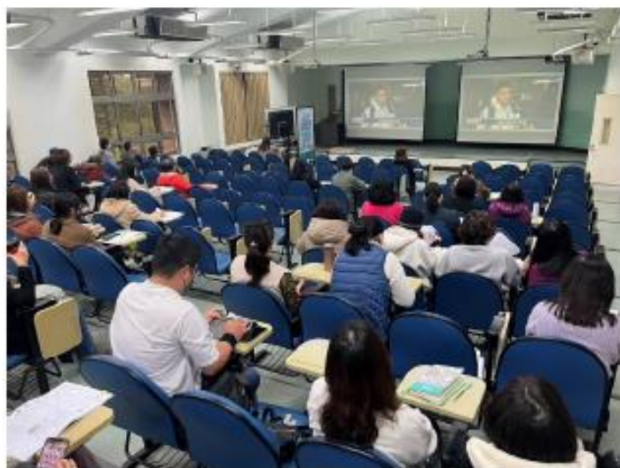
講師運用多樣媒體讓老師