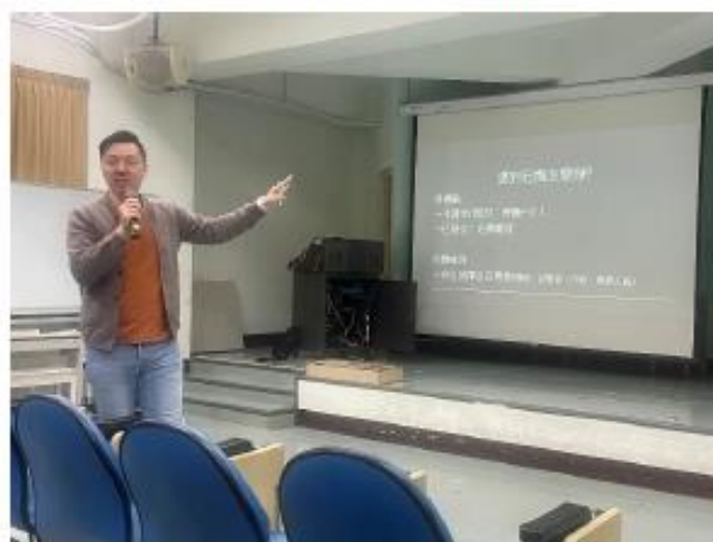
講師提出遇到危機的處理方法