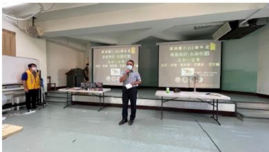
校長為研習作開場，並參與研習。