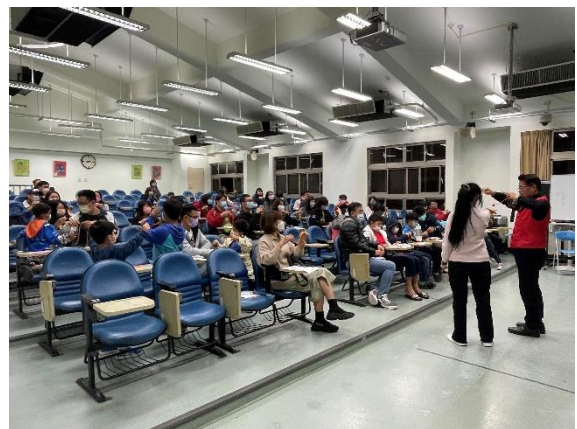
家長認真學習與參與