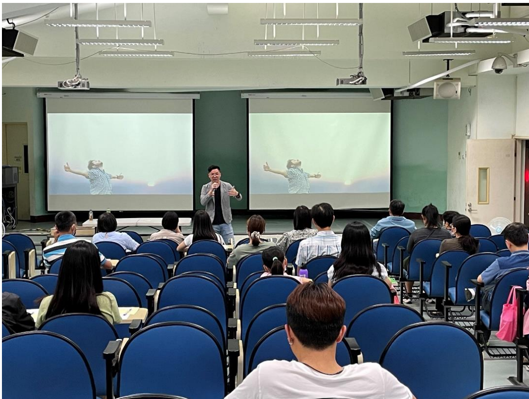
講師帶領參與者練習放鬆紓壓